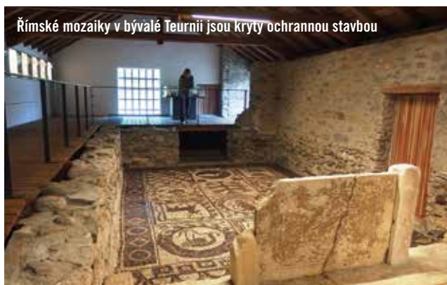
Římské mozaiky v bývalé Teurnii jsou kryty ochrannou stavbou