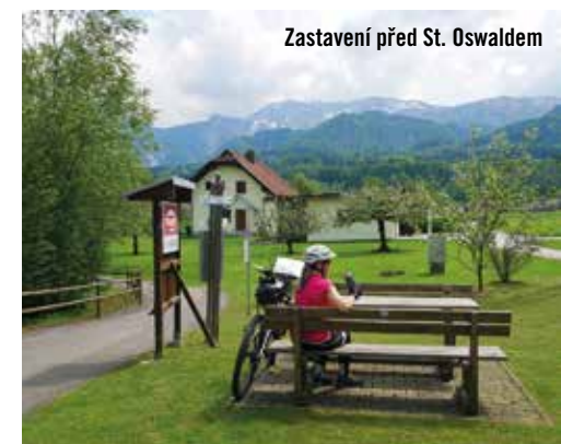
Zastavení před St. Oswaldem