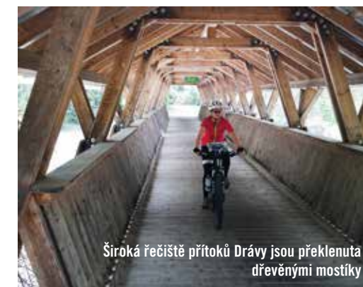
Široká řečiště přítoků Drávy jsou překlenuta dřevěnými mostíky