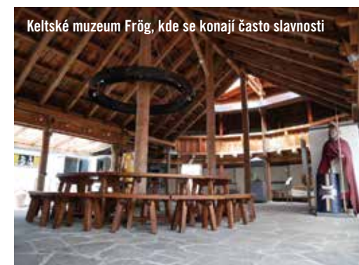
Keltské muzeum Frög, kde se konají často slavnosti