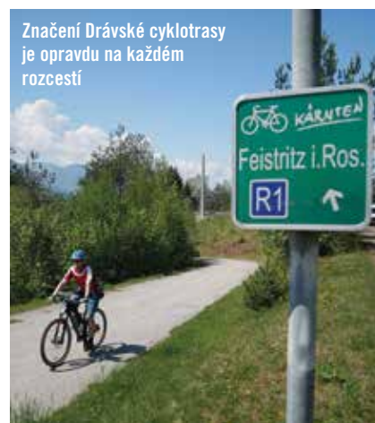
Značení Drávské cyklotrasy je opravdu na každém rozcestí