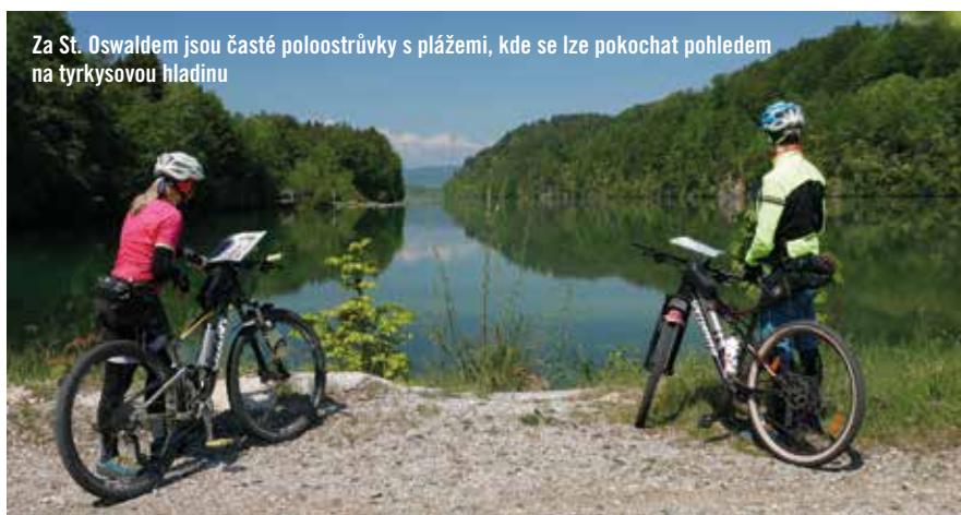
Za St. Oswaldem jsou časté polostrůvky s plážemi, kde se lze pokochat pohledem na tyrkysovou hladinu