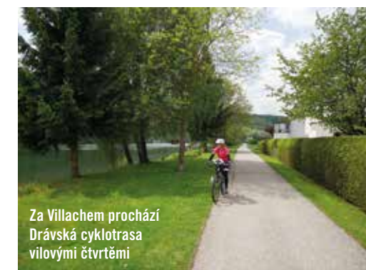
Za Villachem prochází Drávská cyklotrasa vilovými čtvrtěmi