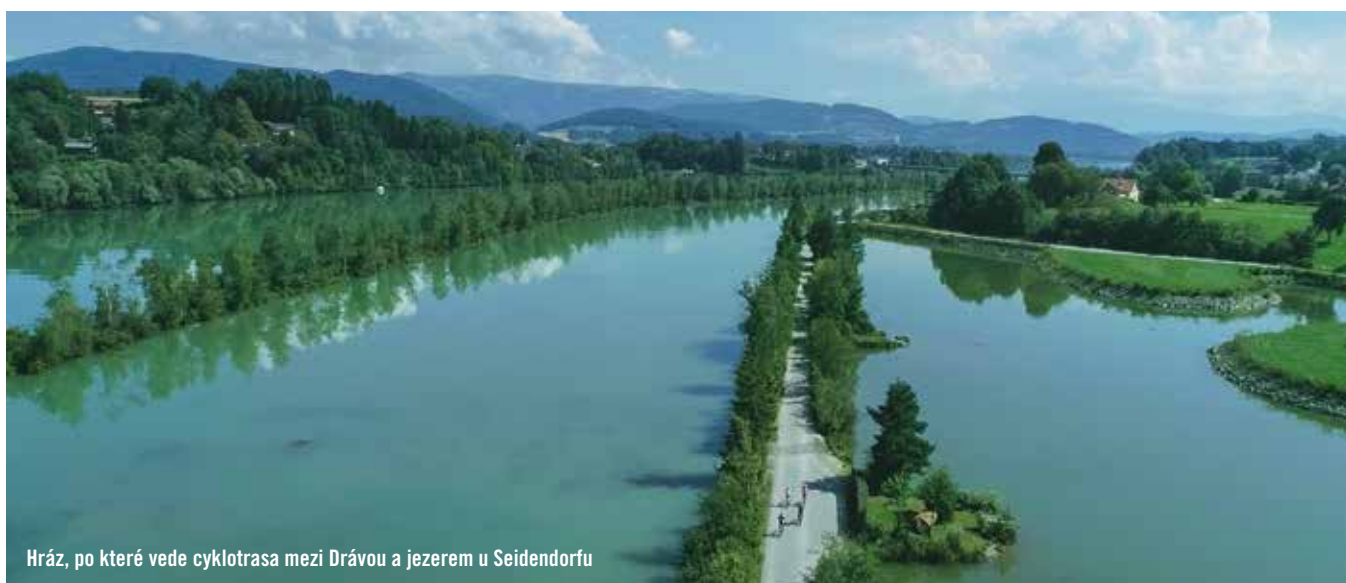
Hráz, po které vede cyklotrasa mezi Drávou a jezerem u Seidendorfu

Mnoho z nás zná Villach jen z dálničních návěstí při cestě do Chorvatska, a je to škoda. Když ho nenavštívíte po Drávské cyklostezce, zastavte se alespoň ve městě. Má příjemnou atmosféru a centrum prochodíte či projedete za chvíli. Při výjezdu z města jsme míjeli nové i staré vilky, ze kterých bylo patrné, že přímo u vody tu nebydlí žádní chudáci. Za Villachem je stezka moc hezká, jde o rekreační zónu města, kterou řeka tvoří společně se Silbersee. To vzniklo zaplavením bývalého dolu Werminghoff II a je využíváno k rekreaci už od 70. let.