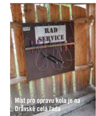
Míst pro opravu kola je na Drávské celá řada