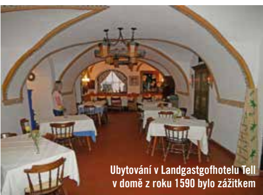
Ubytování v Landgasthofhotelu Tell v domě z roku 1590 bylo zážitkem