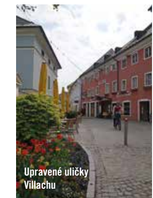
Upravené uličky Villachu