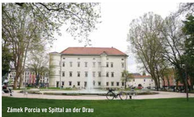
Zámek Porcia ve Spittal an der Drauzug

Drávská cyklostezka probíhá opravdu téměř centrem Villachu. Však také u břehu Drávy bylo město založeno. Respektive u soutoku Drávy a řeky Gail. Do středu Villachu se dostanete na kole naprosto pohodlně. Tepnu vnitřního města tvoří Hauptplatz, což je taková rozšířená promenádní ulice. Villach leží deset kilometrů od slovinských a italských hranic a je tu už naprosto cítit jižanská atmosféra. Všude palmy, kavárničky, občůdky, vše ale udržované s rakouskou precizností.