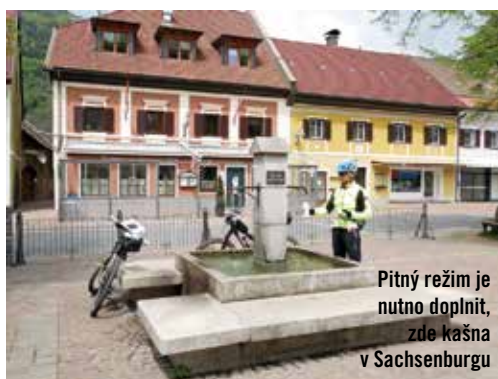
Pitný režim je nutno doplnit, zde kašna v Sachsenburgu