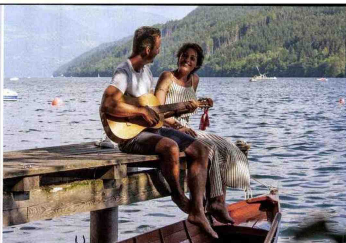
110 Relax in riva a uno tra gli oltre mille laghi cristallini della Carinzia, in Austria, una tra le mete delle nostre vacanze nella natura.