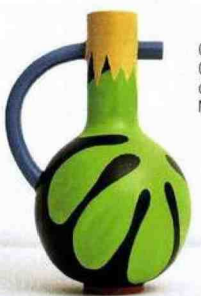
Caraffa Octave di Maison Matisse.