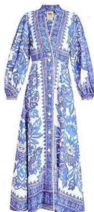
Maxidress in lino e viscosa, 100 per cento riciclati, Farm Rio.