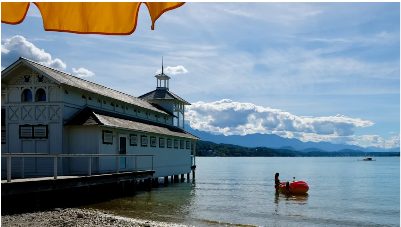
Am Ufer des Wörthersees am Strand des Familienhotels „Werzers“ mit dem berühmten Badehaus von 1895 in Pörschach