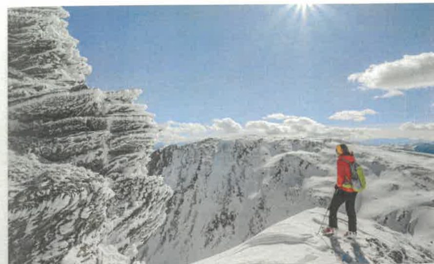
Pohled z vrcholu Falkert na sousední Rodresnock

O pár dní později jsme si na ledové pozdravy ze Sibíře zvykli. Utěšujeme se tím, že na vyšších vrcholech je ještě mnohem méně příjemně. Ignorujeme vítr a vyrážíme na dlouhou hřebenovou túru na Königstuhl. Místo, odkud vycházíme, tedy chatu Dr.-Josef-Mehrl-Hütte, dělí od vrcholu jen 600 výškových metrů. Obvyklá cesta vede údolím Rosanintal a dále do sedla Königstuhlscharte, odkud je člověk na vrcholu za čtvrt hodiny – ale