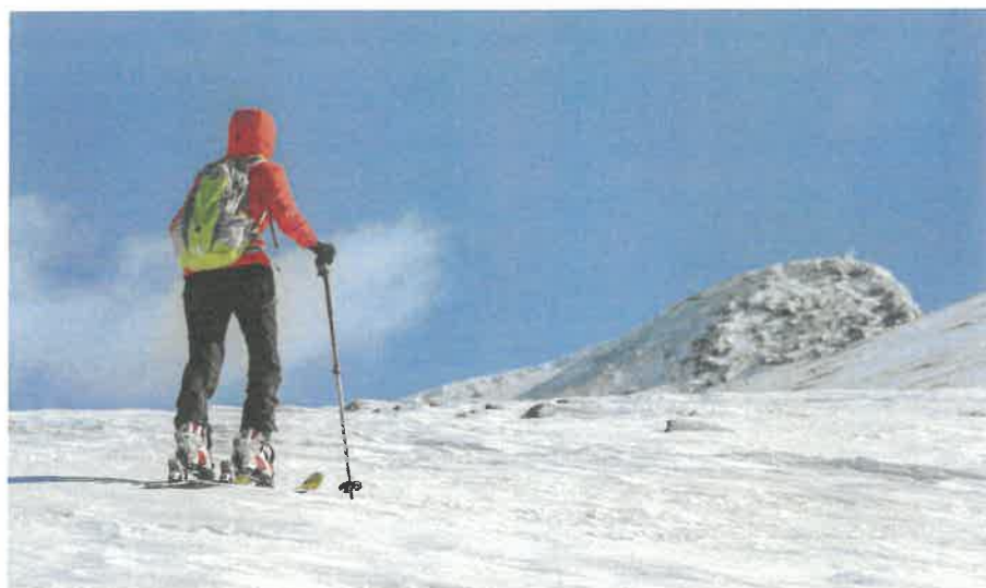
Vrchol Falkert – jeden z vyhledávaných skialpových cílů

„Na nok je to pěkná divočina!“ napadne mě. Čekali jsme mnohem zaoblenější tvary. Prostě dětskou prdíčku. Ale alespoň Falkert je opravdová hora! Budou mít i ostatní noky podobně skalnatá úbočí? Máme necelý týden na to, abychom to zjistili. Na všechny skialpové vrcholy v pohoří Nockberge ale týden nebude stačit ani zdaleka. Jen bývalý národní park Nockberge měl rozlohu téměř 200 kilometrů čtverečních. Jeho následník „Biosférický park Saizburger Lungau a korutanské Nockberge“ se rozkládá na 1500 km 2 .