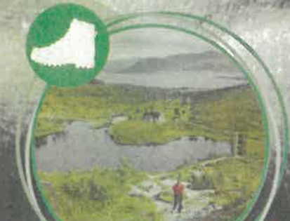
Vesterálské ostrovy - Hory a ostrovy XIII.