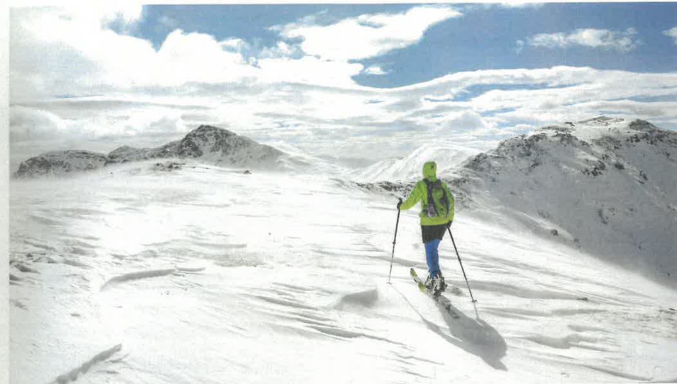
Der Kamm zwischen Stubennock und Königstuhl ist dem Wind ausgesetzt.

Středně obtížná túra. Při výstupu přes Mainock většinou strmé úseky, sjezd většinou po jižních úbočích Klomnocku. Převýšení: 1050 m, čas: 3-4 hod.