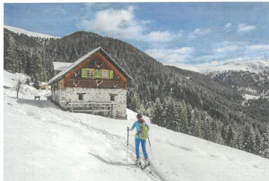
Pod vrcholem Eisenhut - více jelenů než lidí

Východiskem je obvykle parkoviště severně od St. Oswaldu (na začátku lesní cesty k chatě Falkerthaus, 1380 m).