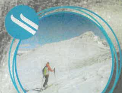
Skialpové túry v pohorí Nockberge

Na Falkert jsme vyrazili z korutanské strany, ze St. Oswaldu nad Bad Kleinkirchheimem. Na tento krásný vrchol se stoupá údolím, pak přes otevřený svah a nakonec po hřebeni. Tisíc výškových metrů je dokonalým terénem pro začátečníky i znalce, jen kdyby nefoukal ten vítr. Od sedla Hundsfeldscharte už opravdu cení ostré zuby. Na posledních pár metrech k vrcholovému kříží ale na