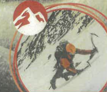
Nadelgrat - Alpské čtyřtisícovky