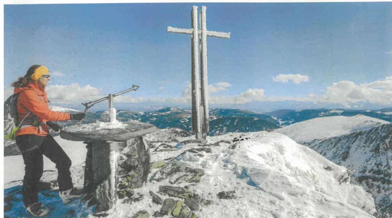
Orientační deska na vrcholu Falkertu usnadňuje orientaci v této části Nízkých Taur

denní penzum noků lze spinit pouze přechodem přes Stubennock, Sauereggnock, Seenock a Friesenhalshöhe až na Königstuhl. Je to úžasná panoramatická trasa, která se může směle nazývat Nockn-Haute-Route, noková haute route. Odhlédneme-li od ledového víchru, je pro mě v Nockberge stejně nejpůsobivější právě tohle: úžasně výhledy za málo potu. Nejen až z Königstuhlu, ale už dlouho před ním se kocháme pohledem na rozeklané vrcholky Julských Alp a Dolomit, na výrazný Ankogel a na skupinu Dachstein na severu. Z Königstuhlu máme výhled hned na tři spolkové země, protože na vrcholu se setkávají Salcbursko, Štýrsko a Korutany. Zato prašan při sjezdu údolím Rosanintal je ryze salcburský a nadýchaný jako onen proslulý dezert!