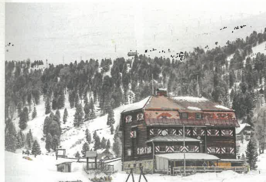
Chata Dr. Josef-Mehrl-Hütte je jedna z mála v zimě otevřených chat

Mapy/Průvodce: Freytag & Berndt, WK 222 „Bad Kleinkirchheim, Biosphärenpark Nockberge“, 1:50000; Gerald Sagmeister, Christian Wutte, Kärnten West, Radstädter Tauern bis Karnischer Hauptkamm, 50 Skitouren, Bergverlag Rother, München 2014. Informace o parku Biosphärenpark: Biosphärenpark Nockberge, Tel.: +43 4275 665, www.biosphaerenparknockberge.at