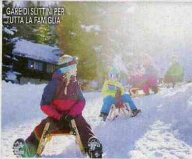
GARE DI SLITTINI PER TUTTA LA FAMIGLIA