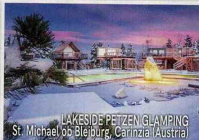
LAKESIDE PETZEN GLAMPING St. Michael ob Bleiburg, Carinzia (Austria)