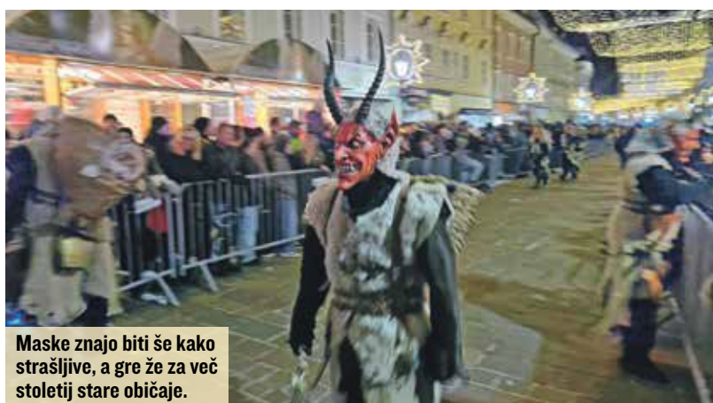
Maske znajo biti še kako strašljive, a gre že za več stoletij stare običaje.

na Vrbsko jezero. Če gre navzgor po 441 stopnicah ali pa z dvigalom, je vrnitev »v dolino« lahko precej hitrejša in adrenalinska – po največjem suhem toboganu v Evropi; po zadnjici drsite kar 120 metrov. Kot se za ta čas spodobi, je tudi tam vse v prazničnem vzdušju s stojnicami. Advent v Celovcu in na Vrbskem jezeru ni le niz dogodkov in na stotine stojnic, temveč premišljeno ustvarjena zimsko-praznična zgodba, ki je vsekakor vredna obiska. Mitja Felc