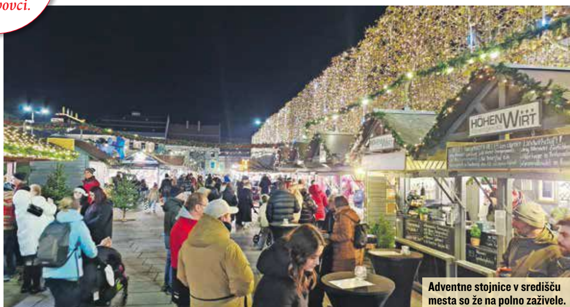
Adventne stojnice v središču mesta so že na polno zaživele.

Parkljev spreved ohranja ravnovesje med strahom in spoštovanjem do ljudskega izročila.