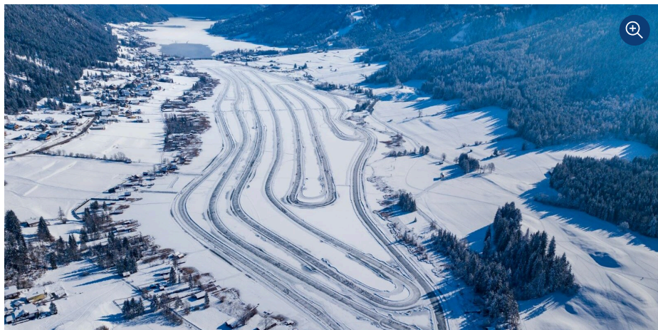
Európa legnagyobb kezelt jégfelülete: Weissensee

Január közepén Karintia délnyugat részére utaztunk többféle téli sportot is kipróbáltunk. Vendéglátóink segítettek felfedezni, hogy a magyar síelők által is jól ismert Nassfeld síközponton kívül milyen lehetőségeket kínál a környék azok részére is, akik nem síelnek vagy snowboardoznak, vagy arra vágnak, hogy színesebbé tegyék a téli üdülést.