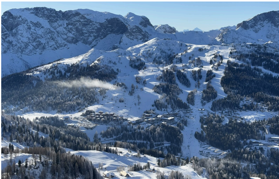
A Tröglbahn új 6 személyes ülőlift pikk-pakk felér 1875 méter magasba

A legfantasztikusabb kilátás a számtalan csúcson a 2.195 méter magas Gartnerkofelről tárult elénk, ahonnan szinte az egész pályarendszer belátható.