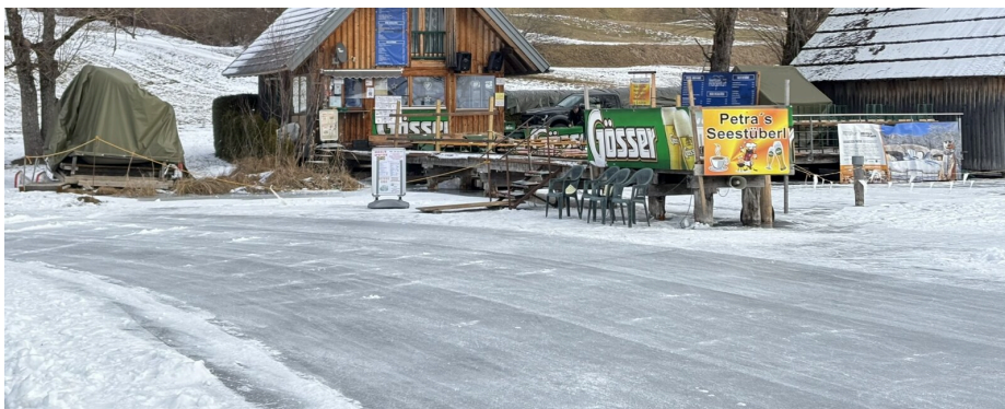
"Drive-in Hütte" a Weissenseen, ahova becsúszhatnak a korisok egy italra, vagy ebédre.