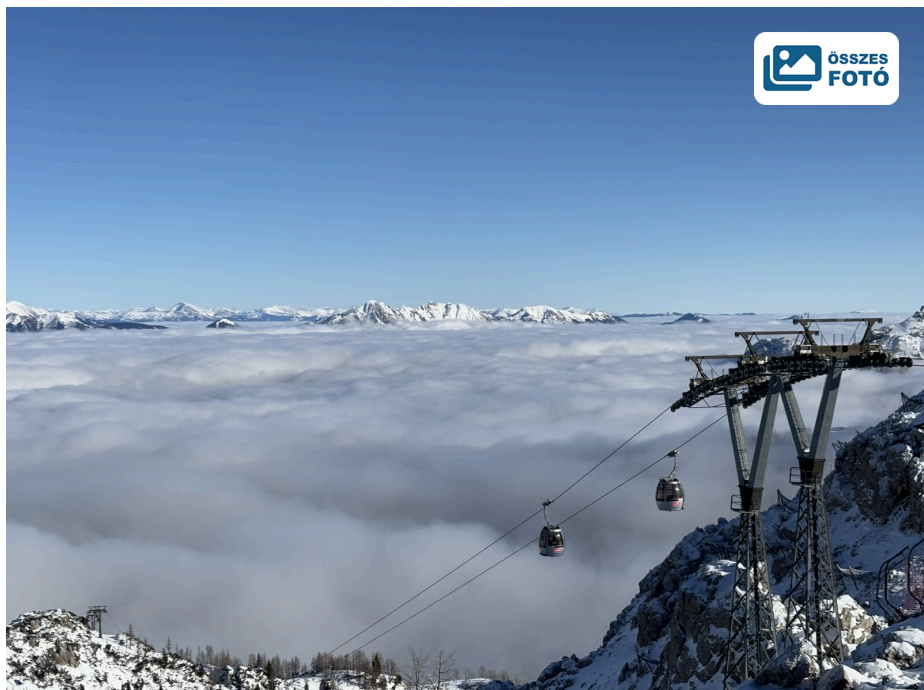
Felhőtenger a völgyben, napsütés a hegyen

Hétköznap lévén a tömeg szépen eloszlott, 2 percnél többet egyik felvonónál sem kellett várakozni, a központi lejtőktől távolabb menve ráadásul több olyan részen is csúszhattunk, ahol a sípályákon is kevesen voltak. Tipp: a helyiek szerint február elejéig különösen érdemes még ide ellátogatni, a karintiai (febr. 10-15.) és stájerországi (febr. 17-23.) síszünetek alatt már várhatóan többen lesznek már a sípályákon.