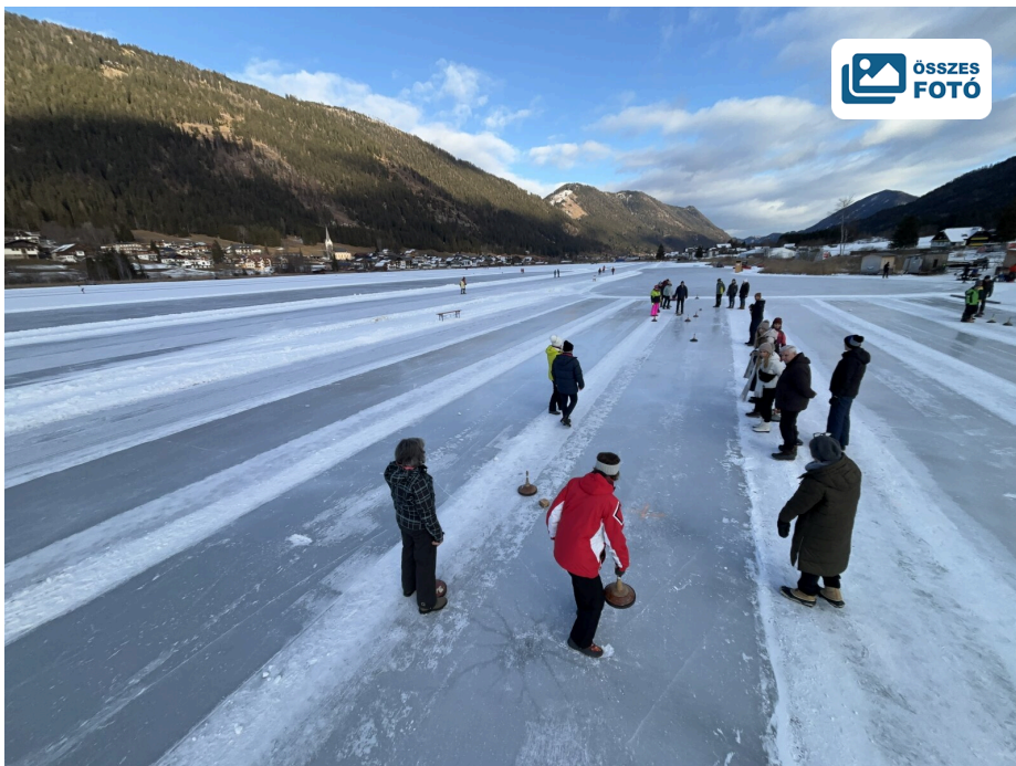
Népszerű téli sport Ausztriában a jégkugli, szabályai igen egyszerűek

Bővebb információk, ajánlatok és programok Weissensee hivatalos weboldalán