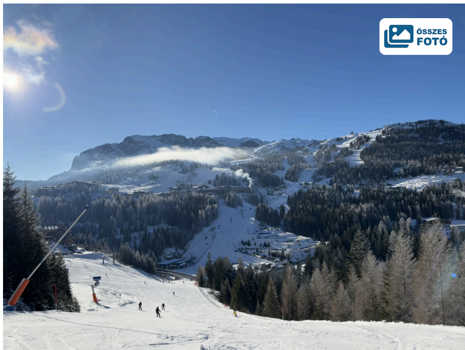
Napközben sem kell sok más síelőt kerülgetni

Az idei szezonra átadott új, 6 személyes "Tröglbahn" ülőlift szépen "teszi a dolgát", érzésre tényleg jóval gyorsabb, mint a társai, az előmelegített ülésfűtésről nem is beszélve.