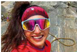
ŮSMĚV A ENDORFINY Výhledy i počasí byly tak dokonalé, že se člověk z té nádhery musel neustále usmívat.