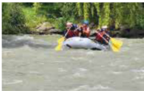
RAFTING V PĚŘEJÍCH Za necelé dvě hodinky jsme vodním korytem urazili něco přes 15 kilometrů. Užili jsme si to všichni.

a tak jsme s radostí pokračovali v místním objevování, tentokrát soutěsky Raggaschlucht ve Flattachu. Hlavní hvězdou je zde potok Raggabach, který si během tisíců let hloubil ve skále svoji cestu, čímž vytvořil pozoruhodné přírodní úkazy. Výsledkem je celá škála působivých vodopádů, od klidných, jiskřivých, až po ty pěnivé a burácející. Rokle v korutánském údolí Mölltal, která byla v roce 1978 vyhlášena přírodní památkou, nás vedla po dřevěných chodnicích kolem strmých skalních stěn – tedy nejspíš nic pro ty, co se bojí výšek. Výlet zabere zhruba 1,5 hodiny. Vstupenka pro dospělého stojí 9 eur, pro děti od 6 do 18 let 6 eur. Držitelé korutánské karty ( www.kaerntencard.at ) pak mají vstup zcela zdarma.