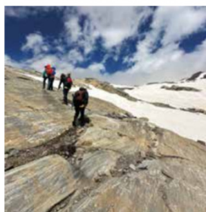
SNĚHOVÉ PLOTNY A SKÁLY Takhle vypadal terén, kterým jsme v doprovodu zkušeného guida stoupali k vrcholu. Přestože vypadá náročně, zvládnou ho i děti.

Č ím víc jsme se blížili k městečku Heiligenblut po panoramatické grossglocknerské vysokohorské silnici, tím deště přidával na intenzitě. Okolí navíc halila všeobjímající pára z lesů a mě napadlo jedině: „Má vůbec cenu jít další den na rafty, jak bylo původně v plánu? No, samozřejmě že má! Jde přece o vodní sport, takže se člověk namočí tak i tak, a i přestože hotel Kärntnerhof nabízel mnoho luxusu a pohodlí, válet se na pokojí je jsme se tam přece nepříjeli. Jaké bylo ale naše překvapení, když nás další den probudily horké sluneční paprsky, které mlsně olizovaly vysokohorské štíty, a dávaly tak najevo, že dneškem období dešťů, které zde v posledním týdnu panovalo, končí. Navlékli jsme proto plavky, na ně neopren, který zabraňuje chladu, a už jsme si to s raftem a instruktorem ze