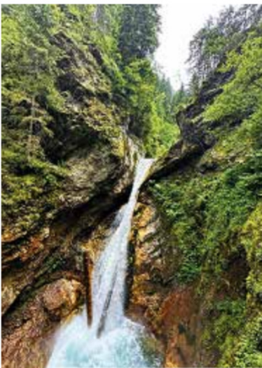
SOUTĚSKA RAGGASCHLUCHT Rokle v údolí Mölltal nás vedla po dřevěných chodnicích kolem strmých skalních stěn. V roce 1978 byla vyhlášena přírodní památkou.