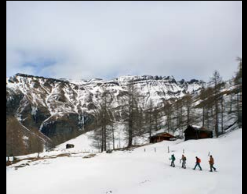
Een wandeling op sneeuwschoenen door National Park Hohe Tauern is de leukste manier om wild te spotten...

Het einde van het komvormige Grosses Fleißtal wordt gevormd door rotswanden en steile hellingen bedekt met sneeuw. Onze parkranger weet uit ervaring dat de steenbokken zich hier graag schuilhouden. De telescoop die ze bij zich draagt, biedt uitkomst. En al snel spotten we de dieren met hun enorme hoorns. Er leven er nu zo'n duizend steenbokken in National Park Hohe Tauern, terwijl de dieren aan het begin van de 19e eeuw bijna waren uitgestorven. Men dacht dat het een soort wonderdieren waardoor er intensief op werd gejaagd, om hun vlees, vacht, hoorns of gewoon als trofee. In de jaren zestig werden de steenbokken opnieuw geïntroduceerd en met succes. In Heiligenblut is er zelfs een heel bezoekerscentrum aan deze dieren gewijd: Haus der Steinböcke . ■