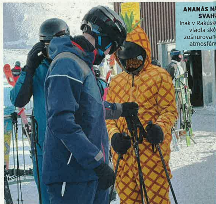
ANANÁS NA SVAHU Inak v Rakúsku vládla skôr zošnúrovaná atmosféra