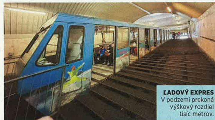
LADOVÝ EXPRES V podzemí prekoná výškový rozdiel tisíc metrov.

rýchlosť policajti. Na druhej strane všetci, aj inokedy rozdrapení Poliaci, Slováci či Česi, sú neuvěřiteľne disciplinovaní. Keď sa rodiny z Ostravska pýtame, prečo Mölltaler uprednostnili pred Liptovom, prekvapia nás. „Ceny rolu nehrajú. Bojíme sa medveďov!“ argumentujú tým, že niekedy v českých novinách už žiadne iné správy zo Slovenska nemajú.