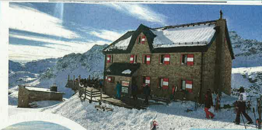
DUISBURG HÜTTE Terasa je plná len počas obeda.