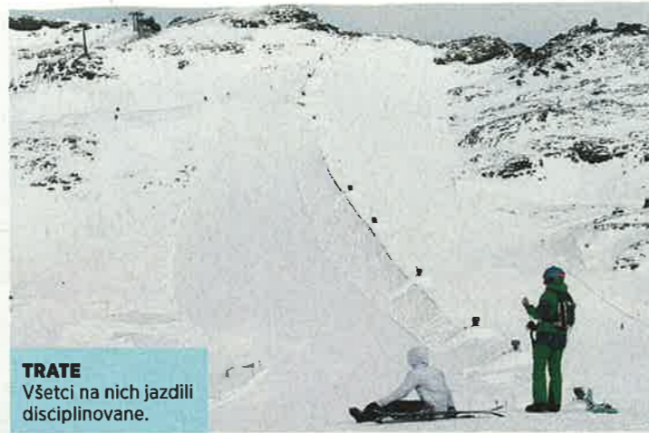
TRATE Všetci na nich jazdili disciplinovane.

Ľudí je na ľadovci tak akurát, prekvapí nás však, že v Korutánsku je len pár snoubordistov a po okraji trate nejde ani jeden skialpinista. Nevidíme skipatrolu ani horskú službu, na rozdiel od Jasnej tu nelieťa každú chvíľu vrtuľník ani pred strediskom nemerajú