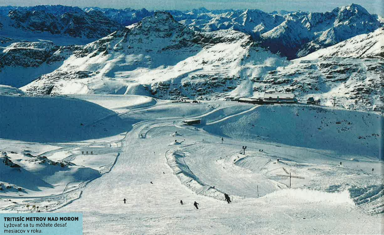
TRITISÍC METROV NAD MOROM Lyžovať sa tu môžete desať mesiacov v roku.