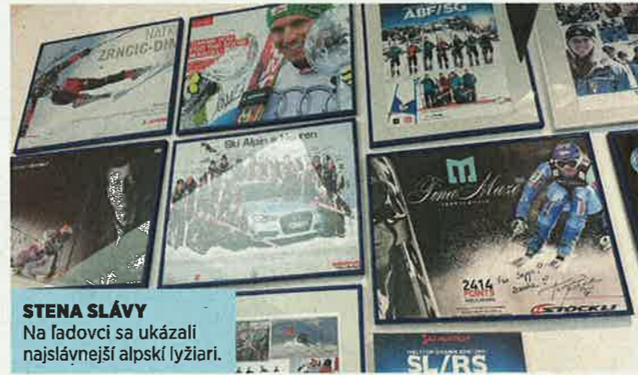
STENA SLÁVY Na ľadovci sa ukázali najslávnejší alpskí lyžiari.