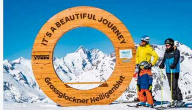
What a view: Es gibt es viele Fotospots mit Großglockner-Panorama.

Hütten Rosbachklause: Die Rosbachklause direkt an der Mittelstation lädt mit ihrer schönen Sonnenterrasse zum Entspannen ein und man serviert herzhaft Klassiker und feine regionale Spezialitäten. Panoramarestaurant Schareck: Das Panoramarestaurant Schareck bietet einen Rundblick auf mehr als 40 imposante 3.000er-Gipfel und leckere regionale Spezialitäten. Ein Tipp ist der hausgemachte Kaiserschmarren frisch aus der Pfanne.