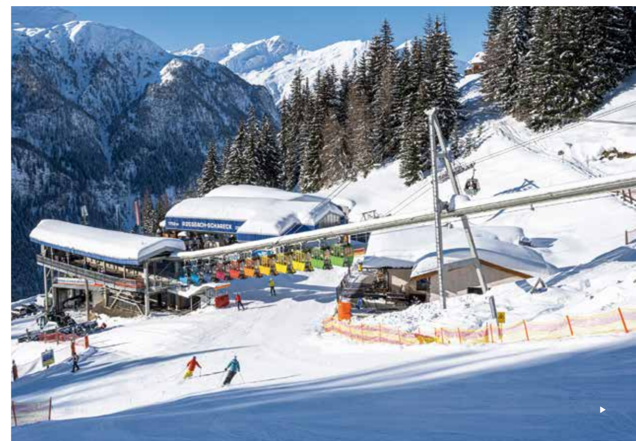
Rechts: Die 1987 eröffnete Tunnelbahn mit ihren farbigen Kabinen ist ein echtes Unikat.