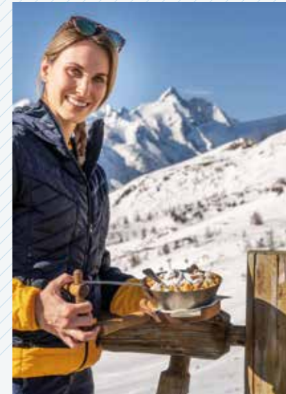
Beim Skifahren darf der Genuss nie auf der Strecke bleiben – frischer Kaiserschmarren geht immer!