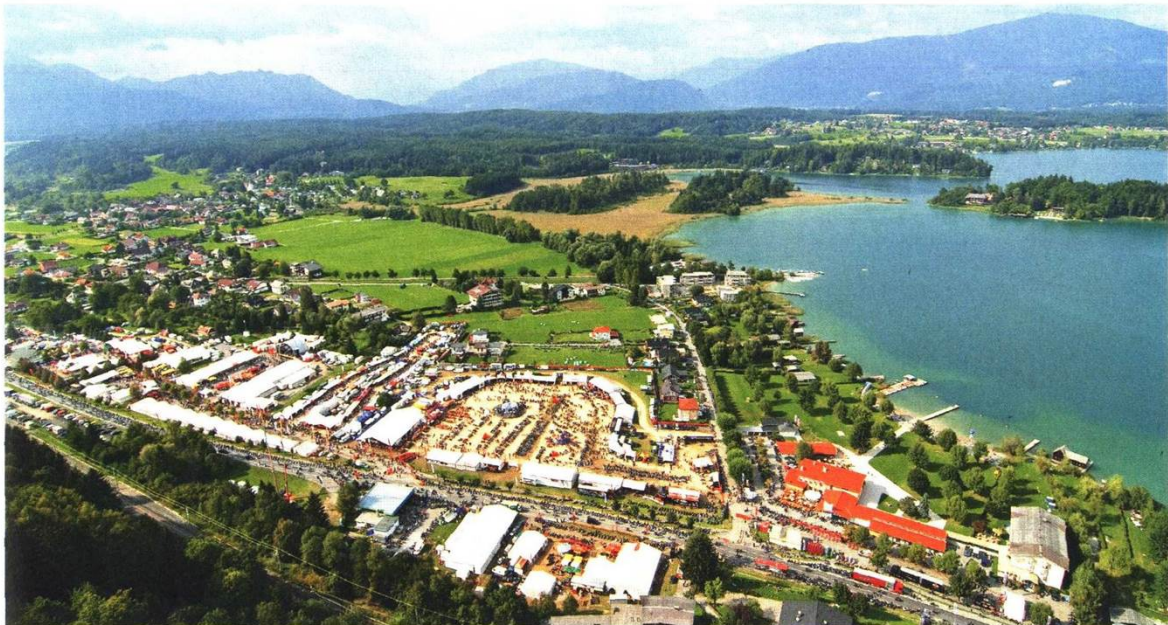
HARLEY VILLAGE AM FAAKER SEE: Der Hotspot der European Bike Week.