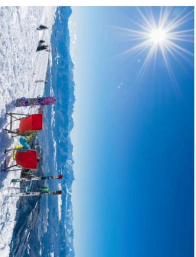
Gerlitzen Skijašište - 18 Preuzmi sliku (1280x720 piksela)