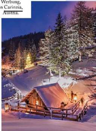
Baita a Kärnten Werbung, in Carinzia, Austria.

La neve che fiocca, le discese sugli sci e sugli slittini, le camminate nei boschi, la calda accoglienza delle stuben nei rifugi sulle piste. Una pausa in montagna d'inverno è speciale. I bambini si divertono all'aperto, lo stress svanisce nelle spa. E si scoprono le diverse culture e tradizioni dell'Alto Adige, della Valle d'Aosta e della vicina Austria.