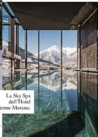
La Sky Spa dell'Hotel Terme Merano.