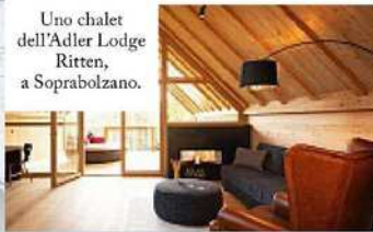
Uno chalet dell'Adler Lodge Ritten, a Soprabolzano.