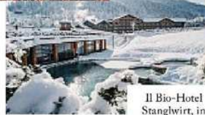
Il Bio-Hotel Stanglwirt, in Tirolo, Austria.

alpinismo con lampada frontale sul Dreiländereck. "Notti di sauna con la luna piena" alle Kärnten Therme Warmbad-Vil-lach (ore 17-23, kaerntentherme.com). Il Wilder Kaiser, uno dei massicci più spettacolari delle Alpi, domina l'orizzonte del Bio Wellness Hotel Stanglwirt, in Tirolo: 12mila metri quadrati di Spa, dove ci abbandona al relax tra la grotta di sale e piscine con acqua che sgorga tra 28° e 37° C. La giornata si apre sulle piste dello SkiWelt Wilder Kaiser-Brixental, o con escursioni con le ciaspole e una puntata alla Fortezza di Kufstein per il Mercatino di Natale (sabato e domenica, 29 novembre-21 dicembre). Poi si torna a immergersi nelle infinity pool affacciate sulle vette, in un universo d'acqua e quiete.