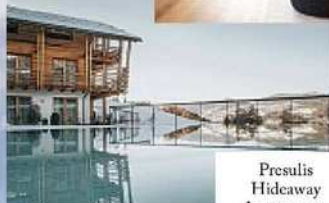
Presulis Hideaway Apartments, a Fiè allo Sciliar.