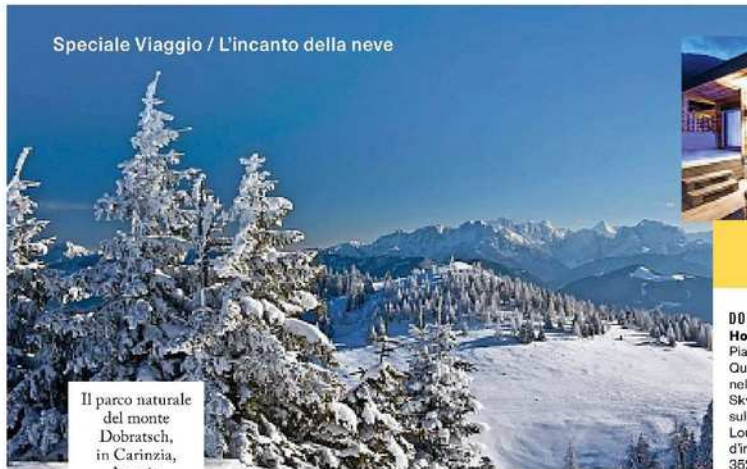
Speciale Viaggio / L'incanto della neve

Il parco naturale del monte Dobratsch, in Carinzia, Austria.