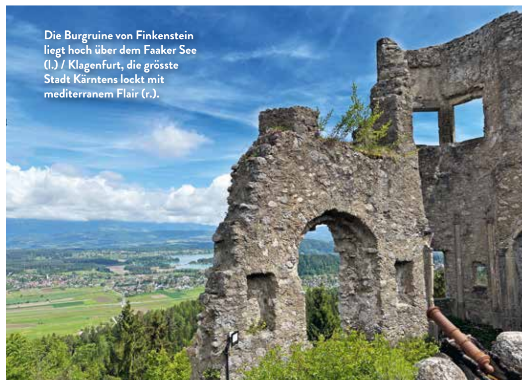
Die Burgruine von Finkenstein liegt hoch über dem Faaker See (l.) / Klagenfurt, die grösste Stadt Kärntens lockt mit mediterranem Flair (r.).

Ob Schafskäse, Gailtaler Speck, Saiblingskaviar oder Zitrusfrüchte – Kärnten verfügt über herausragende Produzenten, die sich der Slow-Food-Philosophie verschrieben haben. Und Besucher sind überall herzlich willkommen.