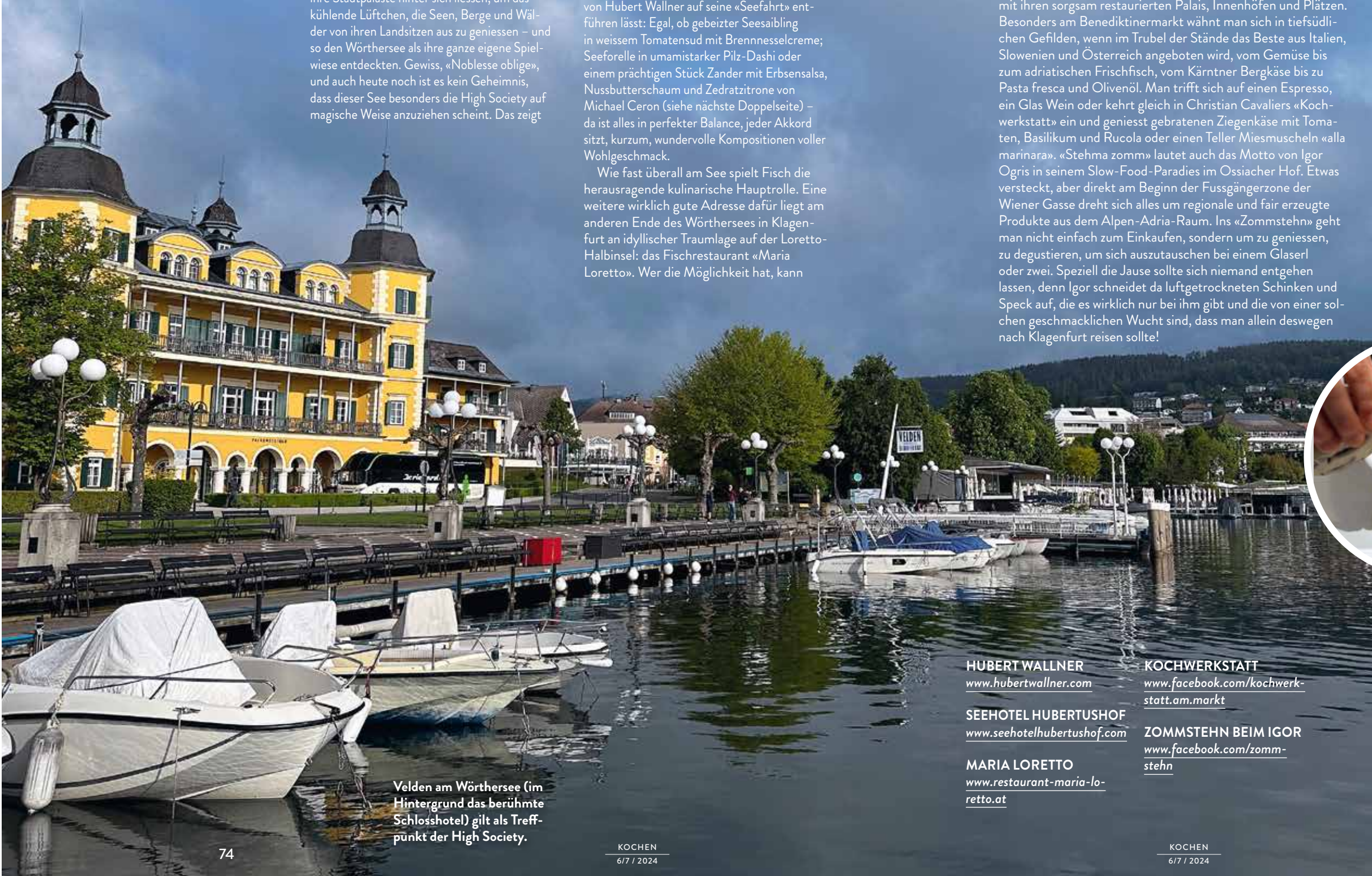
Velden am Wörthersee (im Hintergrund das berühmte Schlosshotel) gilt als Treffpunkt der High Society.