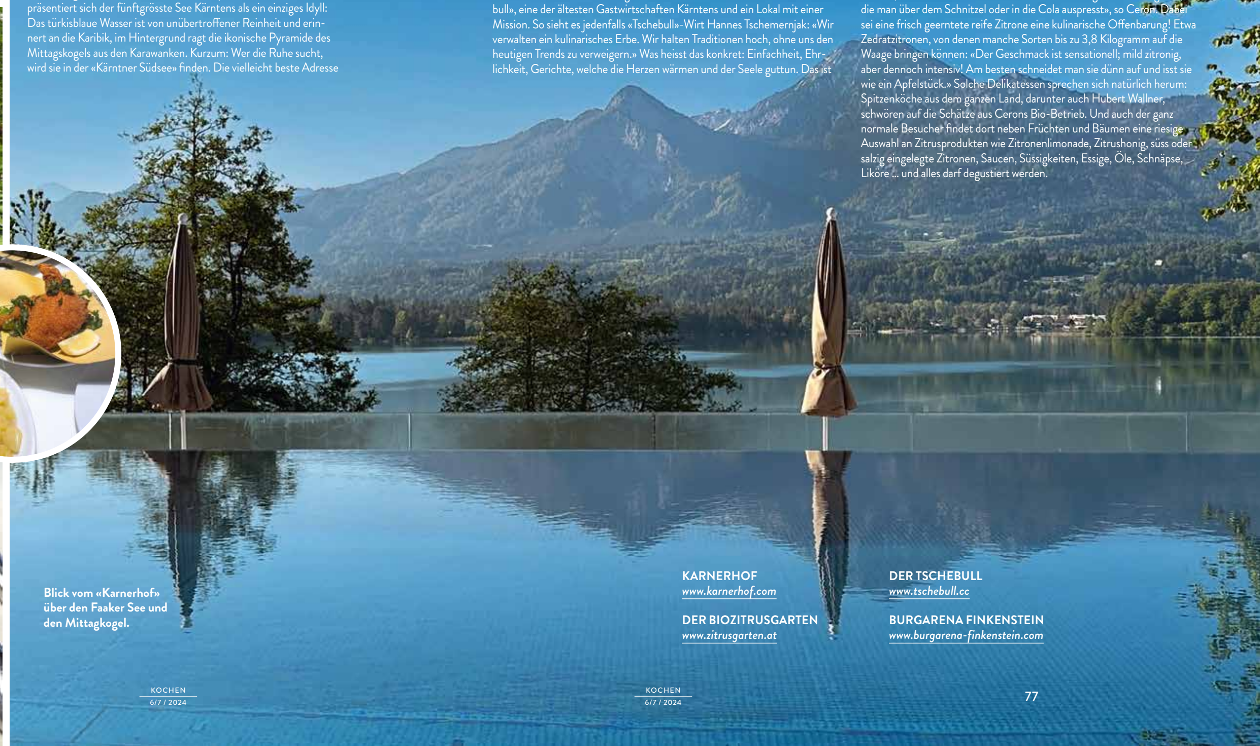
Blick vom «Karnerhof» über den Faaker See und den Mittagkogel.