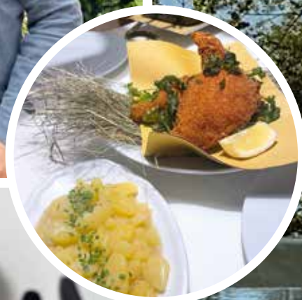
Wohlfühlen: Kärntner «Kasnudl» und Backhendl mit Kartoffelsalat im «Tschebull» (l. r. u. kl. Bild).