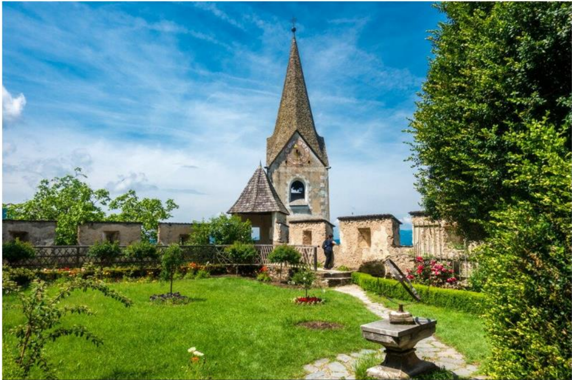
Rózsakert a Hochosterwitz várkastélyban