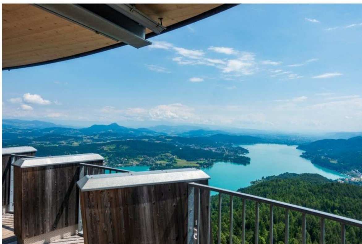
Kilátás a Wörthi-tóra a Pyramidenkogel kilátótoronyból

Maria Wörth-öt messziről felismerni, mivel egy kis nyúlványon hófehér falú templom magasodik. Ki is kötöttünk az alpesi hangulatú faluban, majd busszal felszerpentineztünk a hegy tetejére, ahol a térség egyik legismertebb látnivalója, a Pyramidenkogel kilátótorony áll. A legmagasabb fából épült kilátó címet büszkén viselő torony helyén nem is olyan rég még egy kőkilátó állt, de mióta 2014-ben átadták az új, állítólag Sophia Loren teste ihlette formájú tornyot, hamar rendkívül népszerű lett.