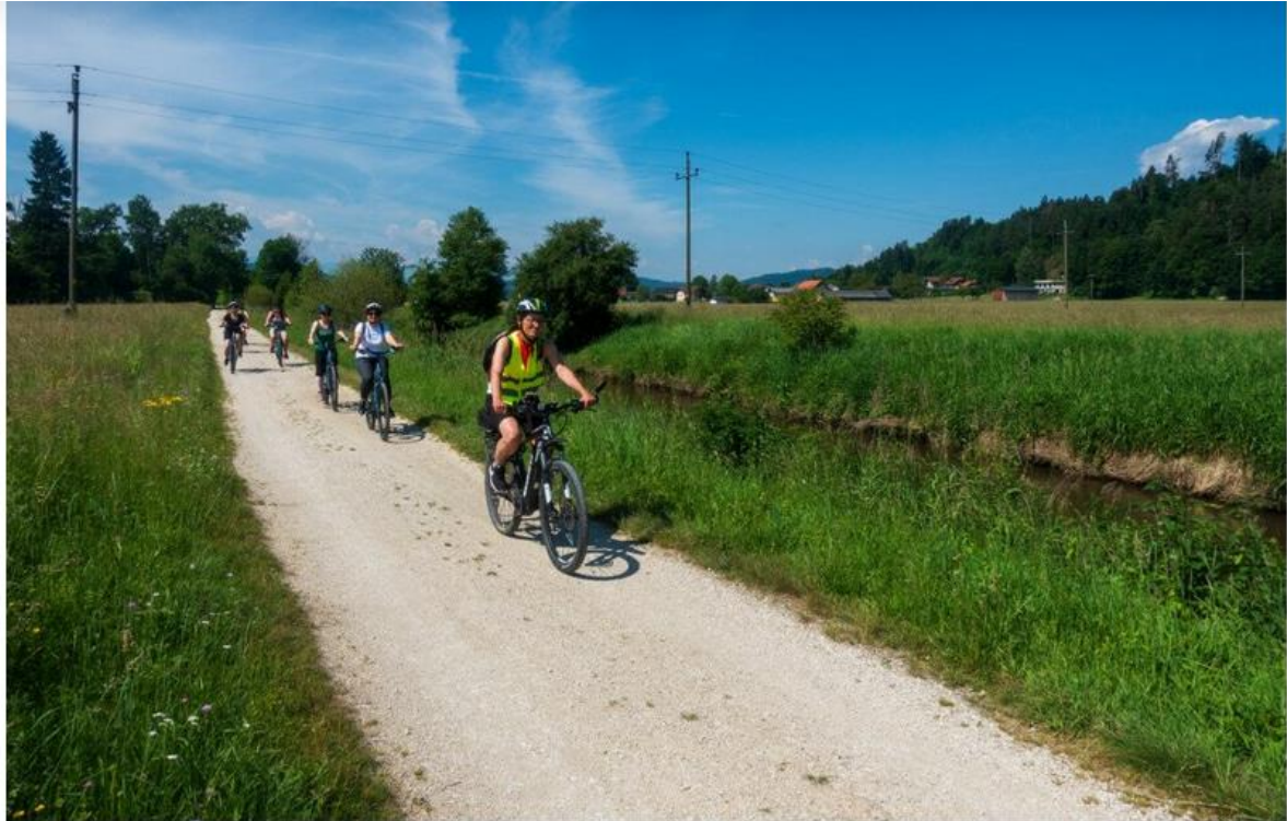
A karintiai tavakat kerékpáros útvonalak kötik össze