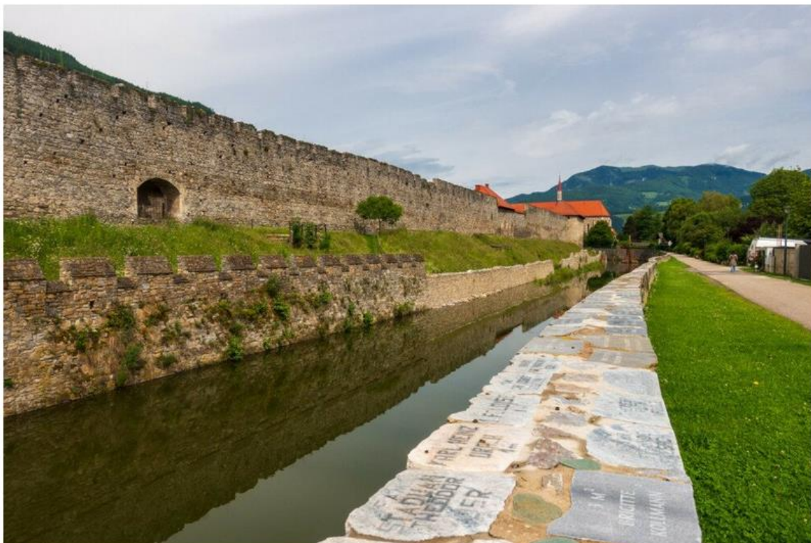
A helyiek támogatásával újíják fel a középkori városfalat Friesach-ban