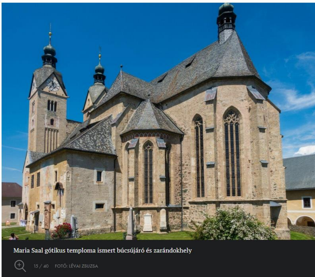
Maria Saal gótikus temploma ismert búcsújáró és zarándokhely