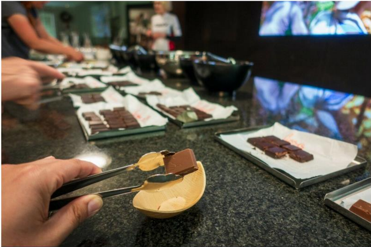
Craigher csokoládéműhely és -kiállítás Friesach-ban