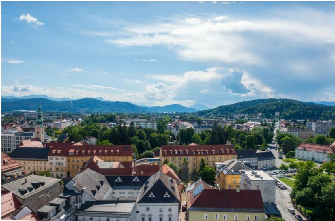
Kilátás a klagenfurti plébániatemplom óratornyának tetejéről

Ismerkedő városnézéssel kezdődött programunk, amely során a középkori eredetű óváros hangulatos utcáit fedeztük fel. Megtudtuk, hogy itt alakították ki Ausztria első sétálóutcáját, és hogy azért áll a főtér közepén egy sárkányos kút (Lindwurm-kút), mert a legenda szerint a városalapításkor egy sárkányt kellett furfangos módon megölni. Azóta a város jelképe és címerállata a sárkány. Apropos, címer: a városházán, ami egyébként a 16. század végén épült reneszánsz stílusban, az egyik teremben több száz történelmi címert láthatunk. A hatalmas termet faltól falig borítják a festett címerek, amelyekre rá is kereshetünk családnév alapján. Ezután a közeli plébániatemplom tornyába lépcsőztünk fel, ami ugyan nem kevés csigalépcsőt jelent, de cserébe a torony tetejéről szédítő kilátás nyílik a városra, és az azt körülölelő hegyekre. A frissen munkába állt toronyőrtől pedig olyan történeteket hallhatunk, amiket brosrákban biztosan nem olvashatunk.