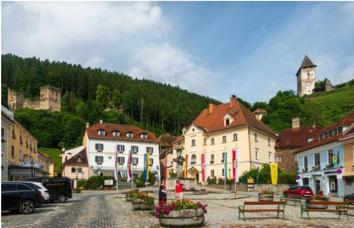
Középkori főter Friesach-ban, Közép-Karintia legszebb kisvárosában

Mint idegenvezetőinktől megtudtuk, Közép-Karintiában különösen fontosnak tartják a helyi hagyományokat, kultúrtörténeti múltjuk bemutatását és megőrzését. Ha mindezeket egy helyre sűrítjük, megkapjuk Friesach városkát. Karintia legrégebb városa a 13. században élte virágkorát, köszönhetően annak, hogy az egyik legfontosabb kereskedelmi útvonalon, Bécs és Velence közt található. Jelentős ezüsbányászatának köszönhetően a 12. században még saját pénzermét is kibocsátottak. Magyar vonatkozása is van a település történetének, ugyanis 1480-ban magyar katonákat telepítettek be, hogy megerősítsék a város védelmét.