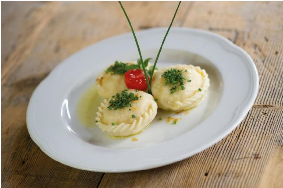
A jellegzetes karintiai käsnudel