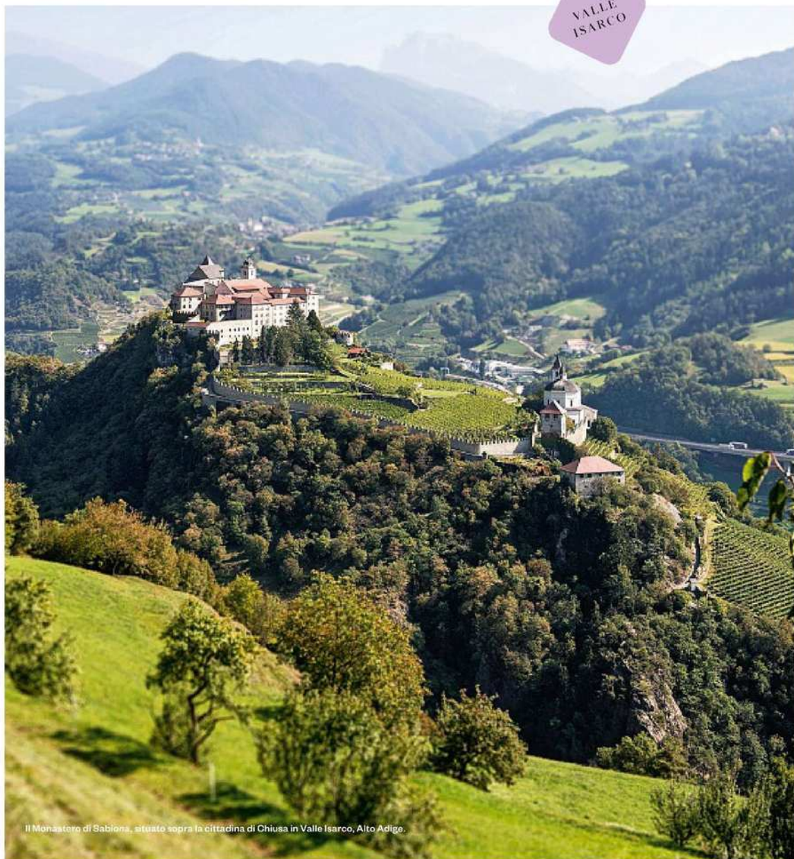
Il Monastero di Sabiona, situato sopra la cittadina di Chiusa in Valle Isarco, Alto Adige.