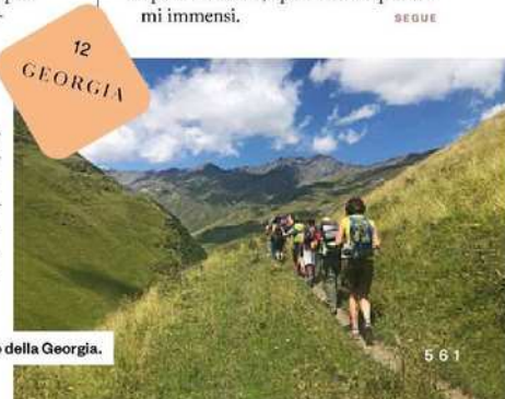
Trekking lungo un sentiero della Georgia.

Aria pura e scenari incontaminati caratterizzano la Georgia , dove Kel 12 ( kel12.com ) propone un trekking nella regione di Khevi (1-8 luglio e 17-24 agosto). Si cammina nella gola di Truso seguendo il fiume Tergi, tra villaggi con torri difensive, chiese e monasteri. L'itinerario include la cascata di Gveleti e l'arrivo ai tremila metri del passo di Sabertse, con vista sul monte Kazbegi (5047 metri). Si visita anche la Chiesa della Trinità, detta di Gergeti, a 2170 metri: sulla cima di una ripida montagna e circondata dalla vastità del paesaggio, è un simbolo della Georgia, sospesa tra storia, spiritualità e panorami immensi. SEGUE