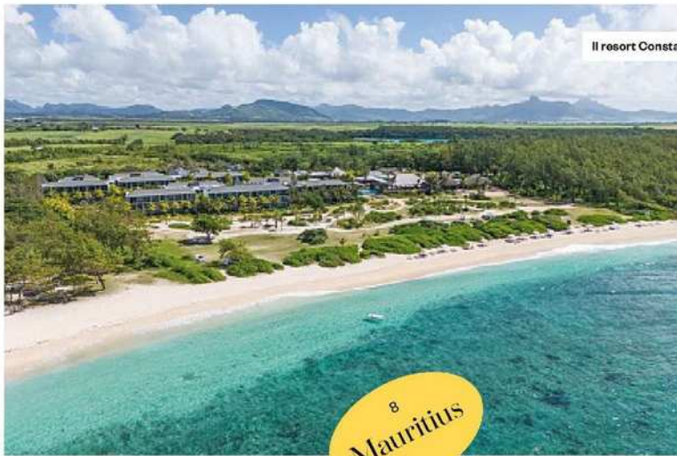
Il resort Constance Le Chaland, sulla costa sud-est di Mauritius.